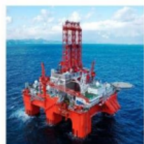
Petróleo e Gás