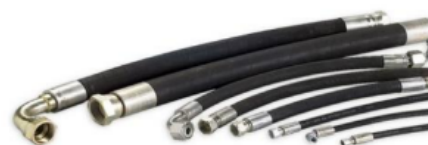
Montador de Mangueira