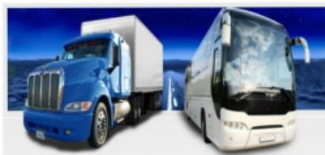
Caminhões e Ônibus